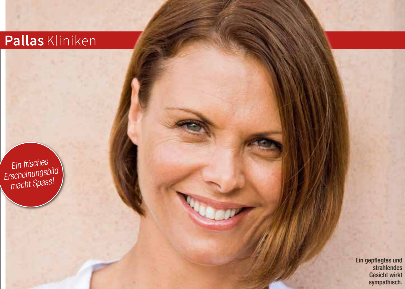
Ein gepflegtes und strahlendes Gesicht wirkt sympathisch.

Ein frisches Erscheinungsbild macht Spass!